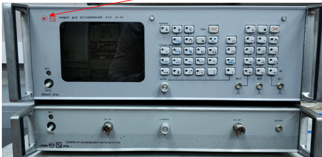
Рисунок 1 - Общий вид средства измерений