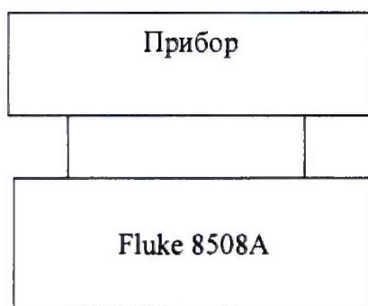
Рисунок 8.1 – Схема структурная определения относительной погрешности измерений выходного напряжения постоянного тока для испытательных сигналов до 1000 В включительно

2) Собрать структурную схему, представленную на рисунке 8.1 для испытательных сигналов до 1000 В включительно, на рисунке 8.2 для испытательных сигналов свыше 1000 В.