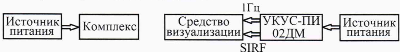
Рисунок 1 – Схема проведения поверки

8.4.1 Собрать схему в соответствии с рисунком 1.