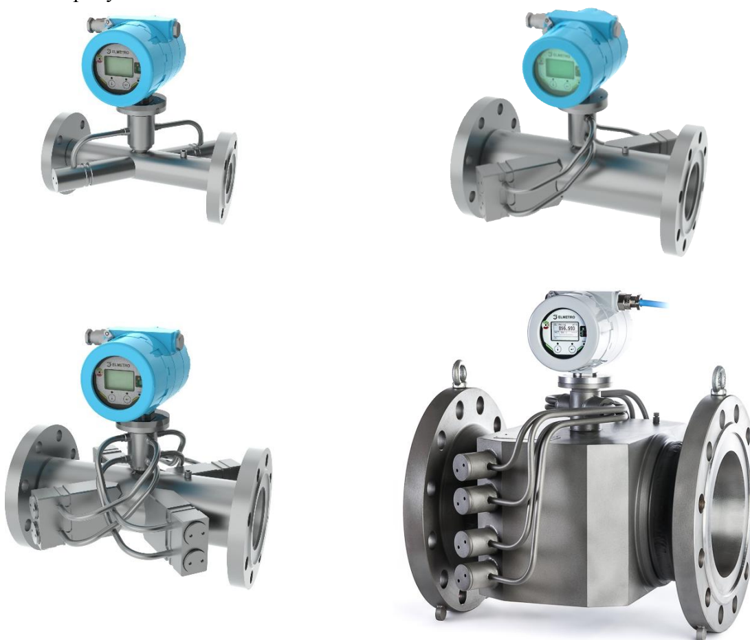
Рисунок 1 – Общий вид расходомеров-счетчиков газа ультразвуковых ЭЛМЕТРО-Флоус (ДРУ)

Общий вид расходомеров-счетчиков газа ультразвуковых ЭЛМЕТРО-Флоус (ДРУ) представлен на рисунке 1.