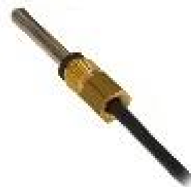
б) комплект платиновых термопреобразователей