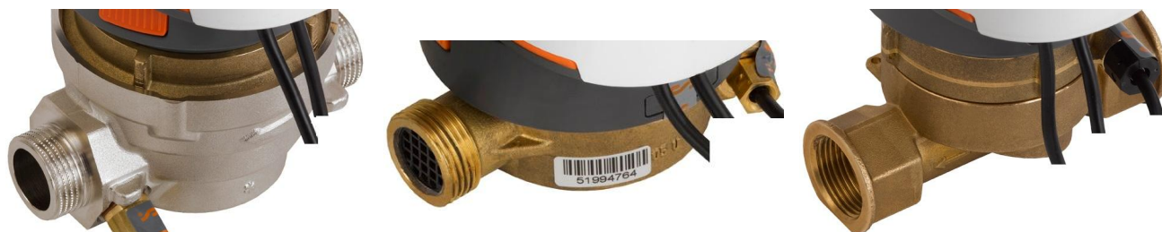
Рисунок 2 – Общий вид преобразователей расхода

Преобразователь расхода может устанавливаться на подающем или на обратном трубопроводе.