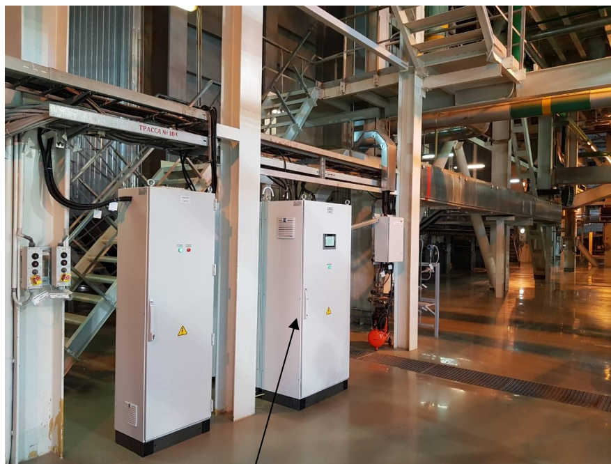
Для защиты от несанкционированного доступа шкафы АСИВ запираются на замок Рисунок 1 – Общий вид системы