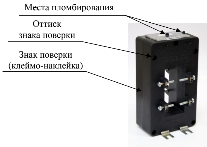
Рисунок 2- Внешний вид трансформаторов тока ТШП-0,66-II с местами пломбирования и нанесения знаков поверки