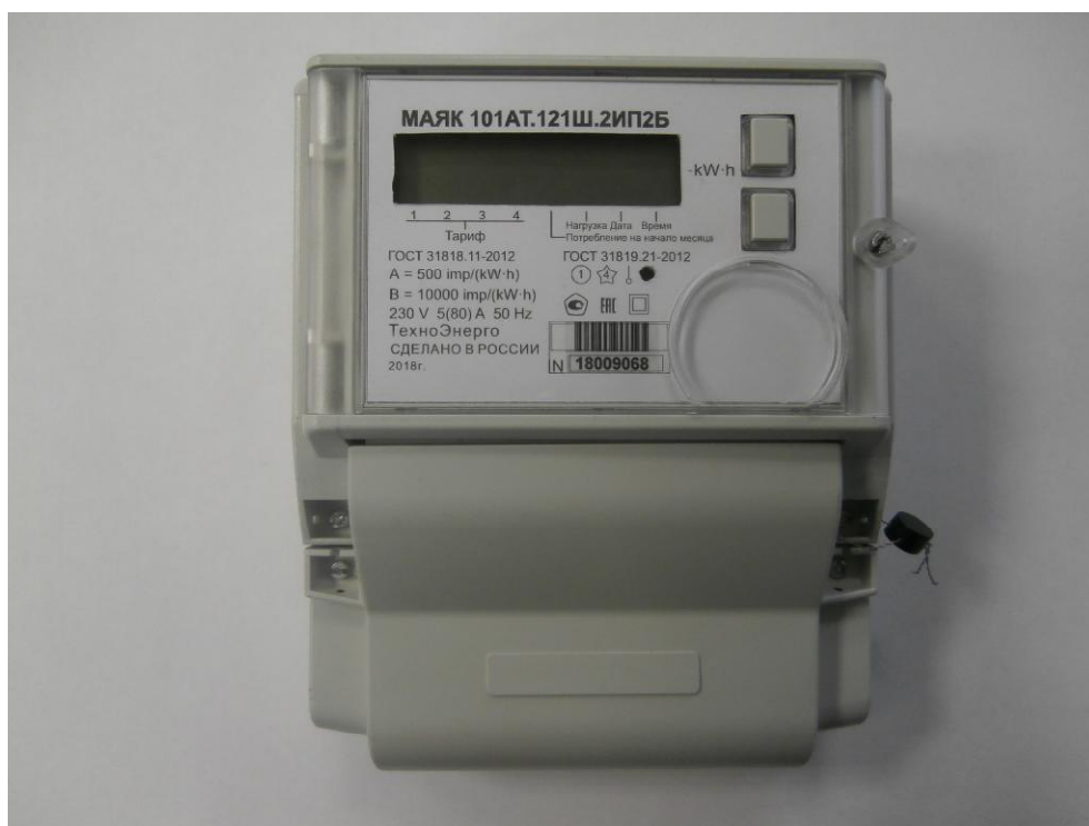
Рисунок 1 – Общий вид счетчика электрической энергии статического МАЯК 101АТ