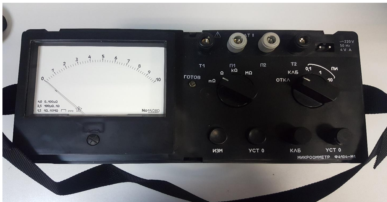
Рисунок 1 - Общий вид микроомметров

Общий вид микроомметров, схема пломбировки от несанкционированного доступа и обозначение мест нанесения знака поверки приведены на рисунке 1 и 2.