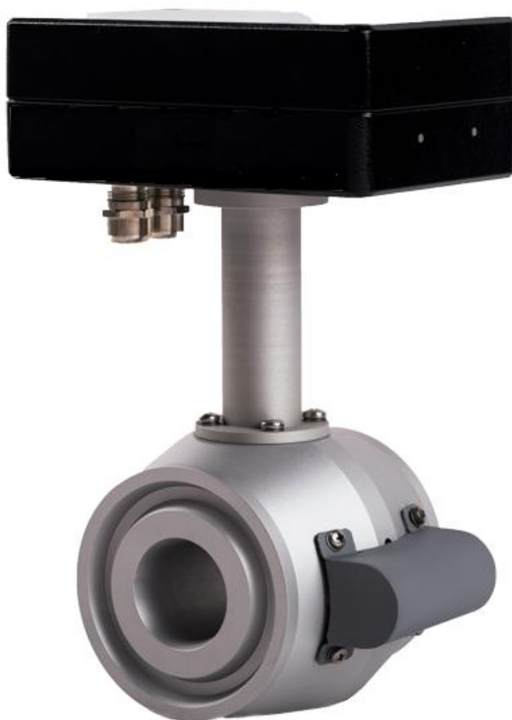
Рисунок 1 – Внешний вид расходомера

Внешний вид расходомера показан на рисунке 1.