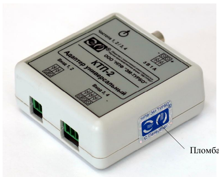
Рисунок 4 – Схема пломбировки АУ от несанкционированного доступа