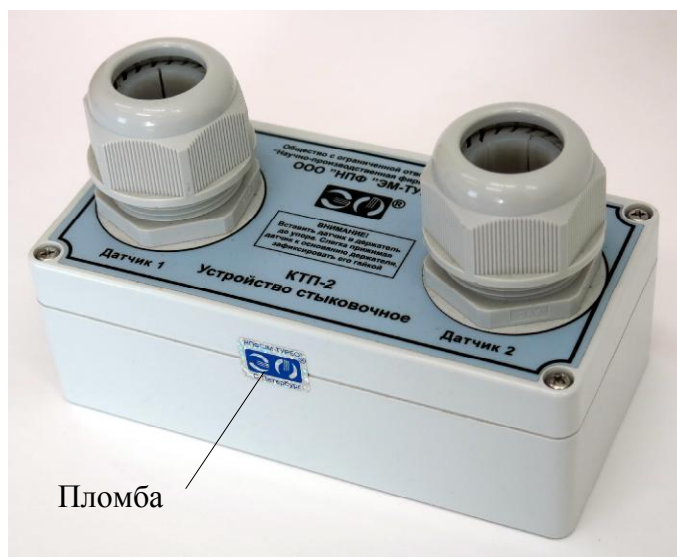
Рисунок 3 – Схема пломбировки УС от несанкционированного доступа