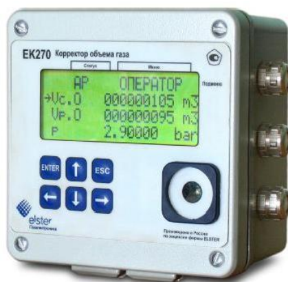
Рисунок 1 – Общий вид корректора объема газа ЕК270

Схема пломбировки от несанкционированного доступа, обозначение мест нанесения знака поверки, приведены на рисунке 2.