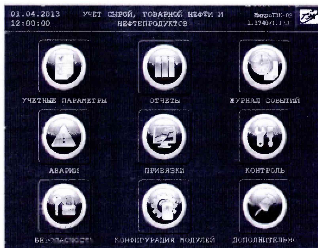
Рисунок 1 – Идентификационные данные ПО

8.5.1.2 Проверку идентификационного наименования и номера версии ПО ИВК проводят сравнением данных, приведённых в 8.5.1.1 настоящей МП и отображаемых в верхнем правом углу главного окна дисплея ИВК (рисунок 1).