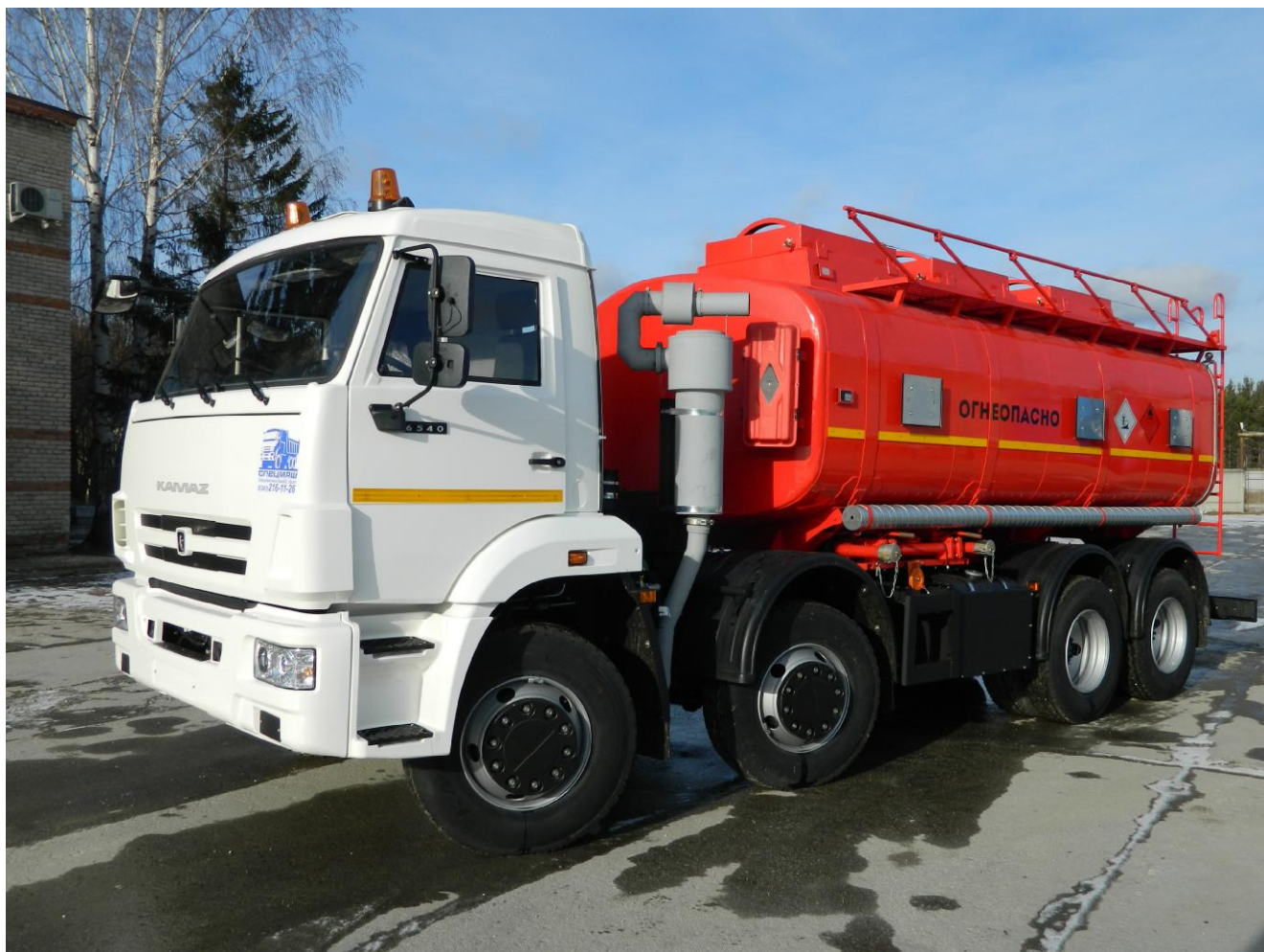
Рисунок 1 - Общий вид автоцистерны АЦН-17 на базе автомобиля КАМАЗ 6540