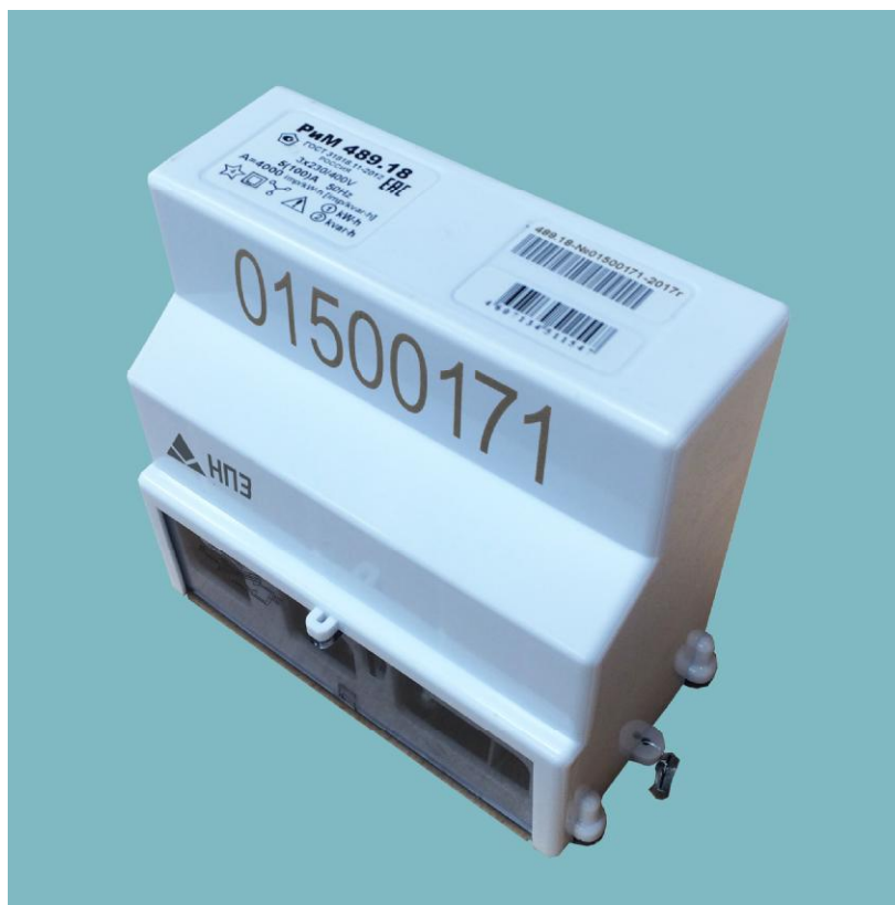
Рисунок 1 – Общий вид счетчиков РиМ 489.1X