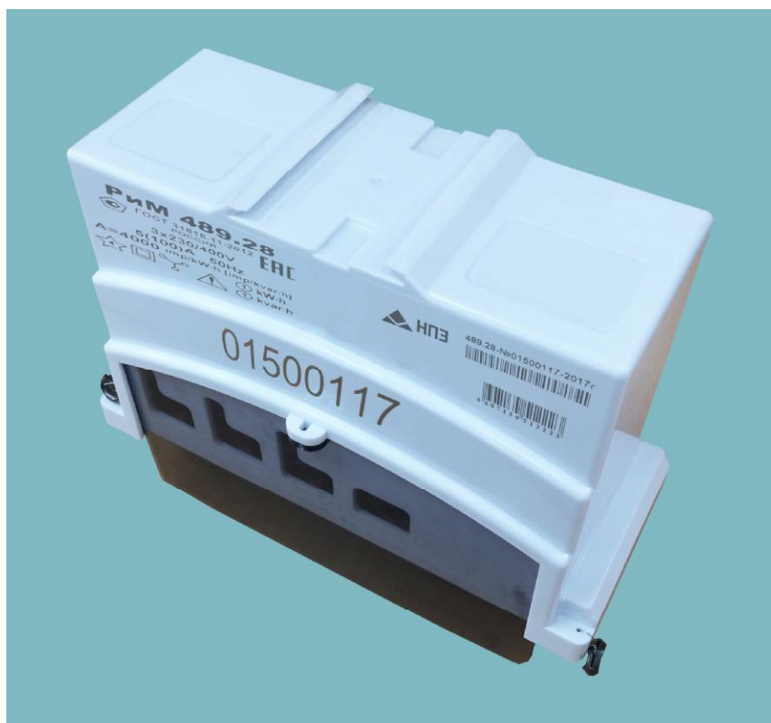
Рисунок 2 – Общий вид счетчиков РиМ 489.2X