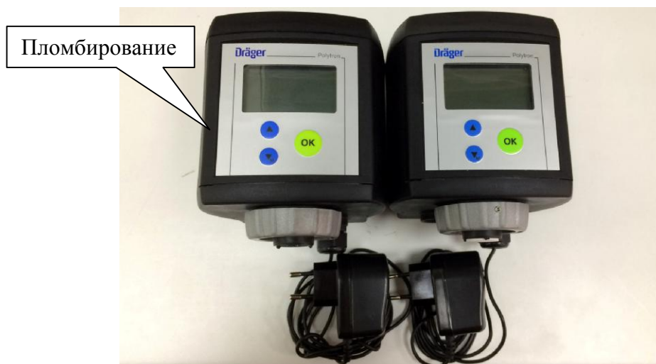
Рисунок 2 – Общий вид датчиков контроля стабильности Dräger Polytron 7000 (с сенсорами Hydrazin и NO 2 )