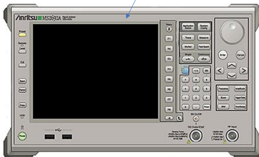
Рисунок 1 - Внешний вид передней панели анализаторов