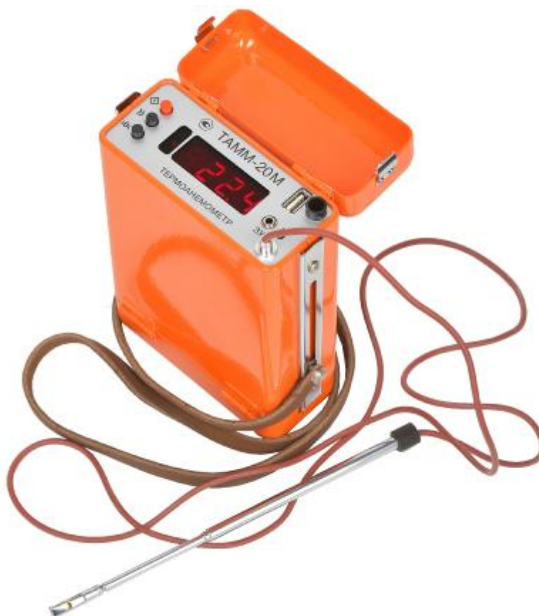
Рисунок 2 – Общий вид измерителя со стороны термометра и анемометра