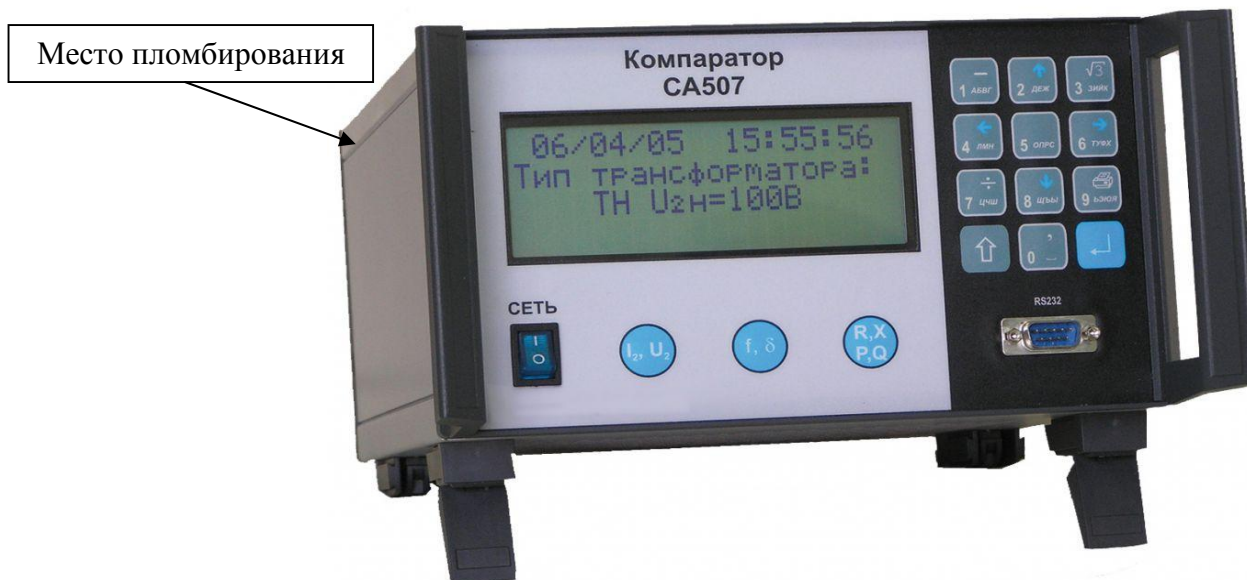
Рисунок 1 – Общий вид компаратора и схема пломбировки

В комплект поставки компараторов может входить источник тока СА3600, который состоит из четырех блоков прямоугольной формы: блока коммутации БК и трех трансформаторов силовых ТС1, ТС2, ТС3. Внешний вид представлен на рисунке 2.