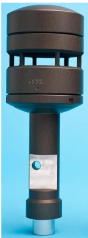
Рисунок 1 — Общий вид датчика