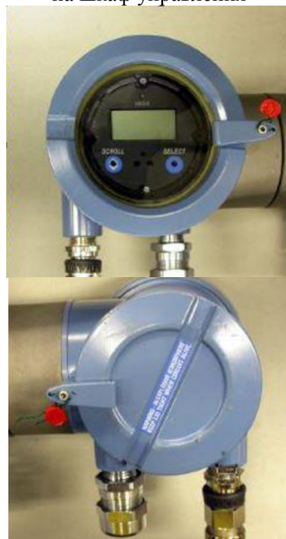
Рисунок 5 – Пломбы поверителя препятствующие вскрытию электронного преобразователя СРМ