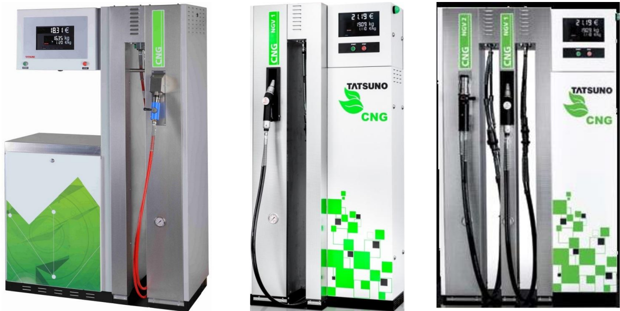
а) OCEAN BMP 40xx.OEx/CNG

Схема пломбировки от несанкционированного доступа, обозначение места нанесения знака поверки представлены на рисунке 2.