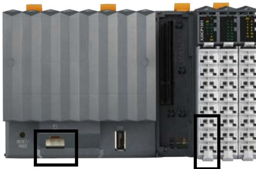
Рисунок 2 - Места пломбирования контроллера установок (показаны черными прямоугольниками)