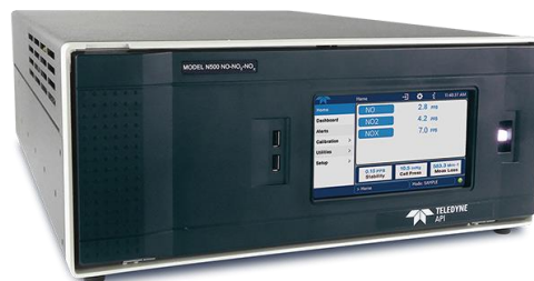
Рисунок 2 – Общий вид газоанализаторов Teledyne API моделей N100, N101, N102, N100U, N100H, N108, N200, N200P, N200U, N200U NO y , N200UP, N200M, N200H, N201, N265, N500, N300, N300U, N300M, N360, N360M, N400, N802, N901