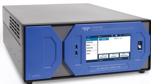
Рисунок 1 – Общий вид газоанализаторов Teledyne API моделей T100, T101, T102, T100U, T100H, T108, T200, T200P, T200U, T200U NO y , T200UP, T200M, T200H, T201, T265, T300, T300U, T300M, T360, T360M, T400, T802