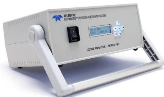
Рисунок 3 – Общий вид газоанализаторов Teledyne API модели 430 (портативное исполнение)