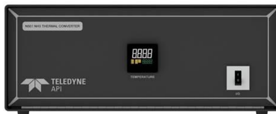
Рисунок 6 – Общий вид конвертера для модели N102, N108, N200U NO y , N201