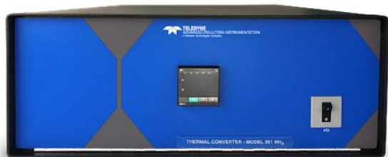
Рисунок 5 – Общий вид конвертера для моделей T102, T108, T200U NO y , T201