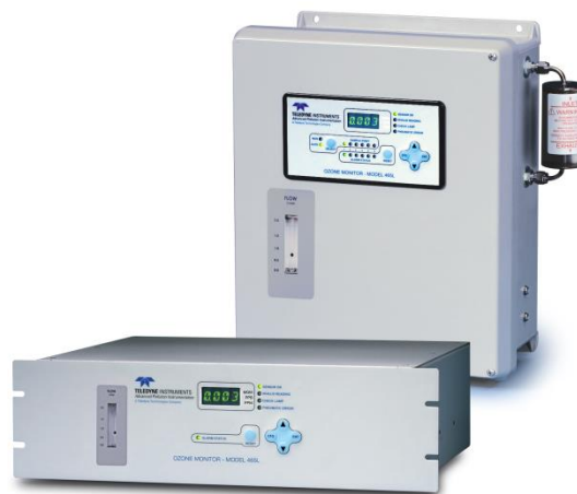
Рисунок 4 – Общий вид газоанализаторов Teledyne API модели 465L (настенное и настольное исполнение)