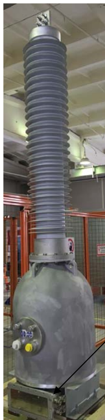
Рисунок 1 - Общий вид трансформаторов

Общий вид трансформаторов представлен на рисунке 1, общий вид клеммной коробки с обозначением места пломбирования от несанкционированного доступа представлен на рисунке 2.