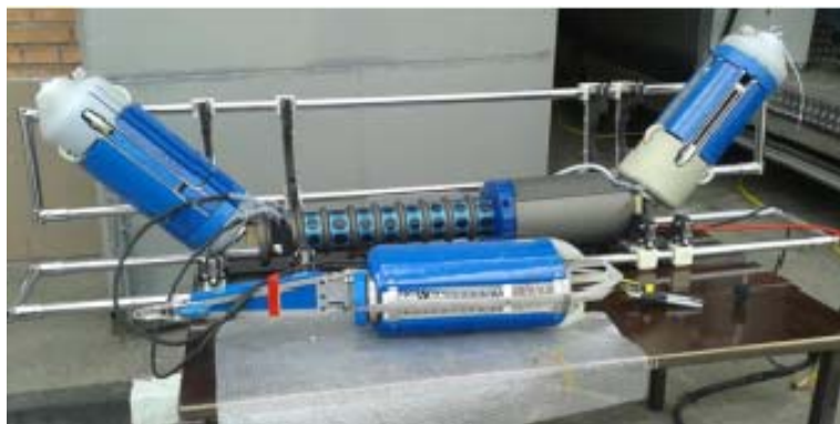
Рисунок 2 - Общий вид модуля инспекционного внутритрубного PS-3

Пломбирование модуля инспекционного внутритрубного PS-3 не предусмотрено.