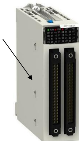
в) модификации ВМХАRT0814RU, ВМХАRT0814HRU