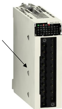
а) модификации ВМХАМІ0810RU, ВМХАМІ0800RU, ВМХАМІ0810HRU, ВМХАМІ0410RU, ВМХАМІ0410HRU, ВМХАМО0410RU, ВМХАМО0410HRU ВМХАМО0802RU, ВМХАМО0210RU, ВМХАМО0210HRU, ВМХАММ0600RU ВМХАММ0600HRU