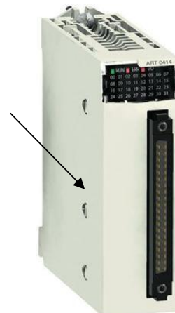
б) модификации ВМХАRT0414RU, ВМХАRT0414HRU