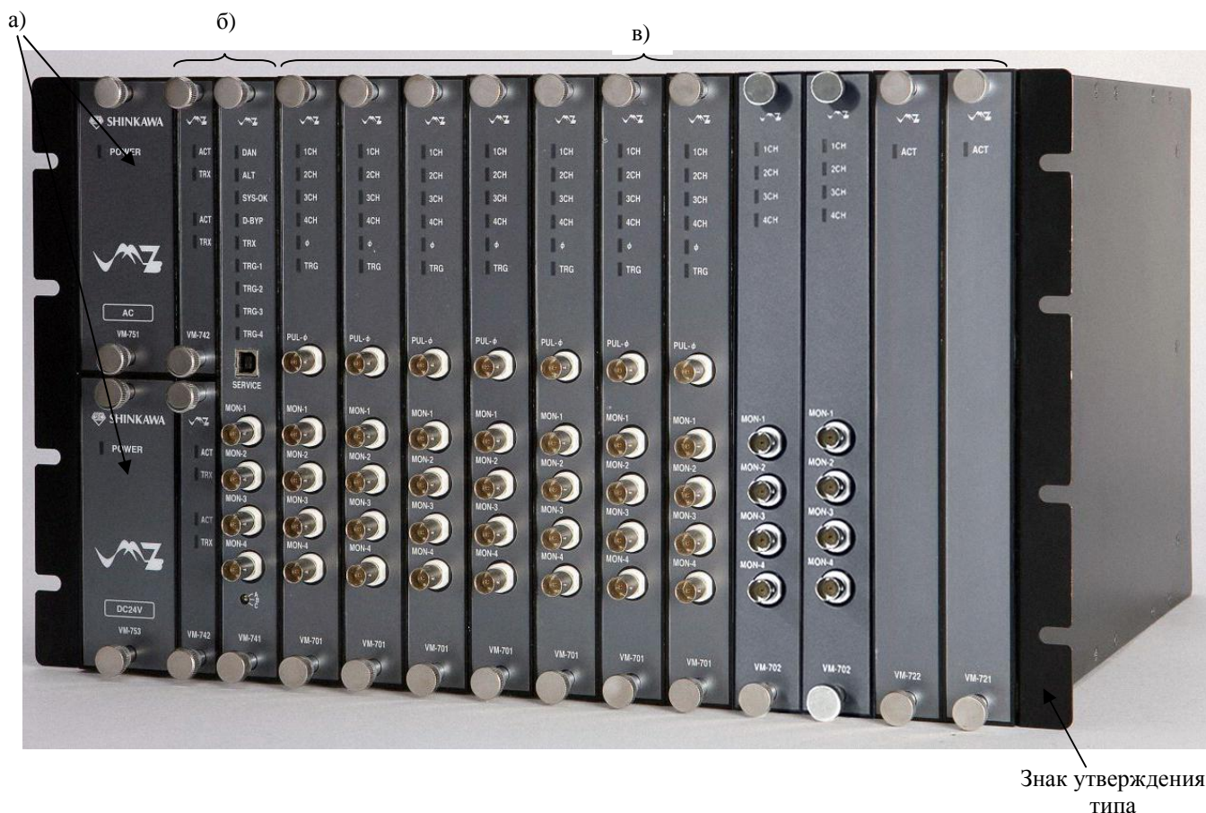
Рисунок 2 - Общий вид комплекса вибромониторинга модели VM-7В, где а) модули VM-751В; VM-753В; VM-754В б) модули VM-742В и модуль VM-741В в) модули VM-701В; VM-702В и модули VM-721В; VM-722В

Пломбирование комплексов вибромониторинга моделей VM-7 и VM-7В не предусмотрено.