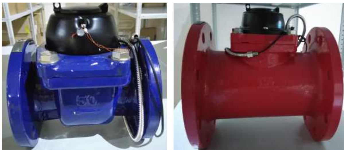
Рисунок 1 - Общий вид счетчиков холодной и горячей воды турбинных «Смарт Митер»

Схема пломбировки от несанкционированного доступа, обозначение места нанесения знака поверки представлены на рисунке 2.