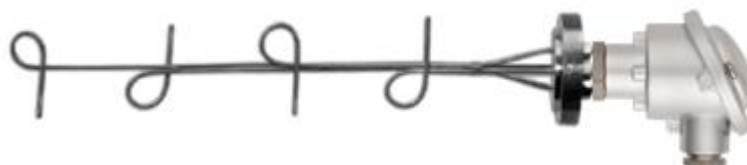
Рисунок 19 - Общий вид многозонного термопреобразователя 901820