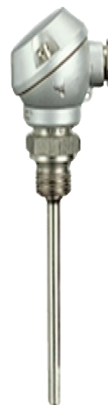
Рисунок 5 - Общий вид термопреобразователей 901230