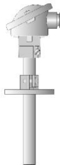
Рисунок 11 - Общий вид термопреобразователей 901110