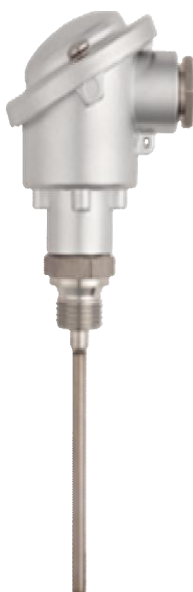
Рисунок 4 - Общий вид термопреобразователей 901220