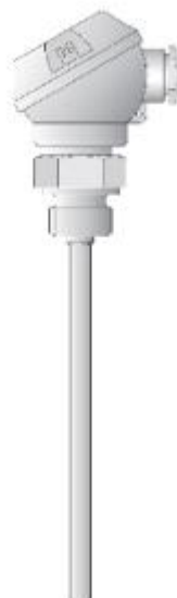
Рисунок 10 - Общий вид термопреобразователей 901030