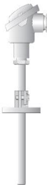
Рисунок 12 - Общий вид термопреобразователей 901120