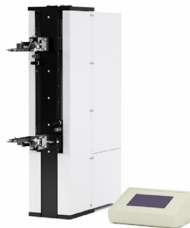
Рисунок 2 - Общий вид измерителей перемещений (деформаций) автоматических ИДА X-V