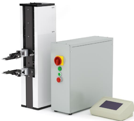
Рисунок 1 - Общий вид измерителей перемещений (деформаций) автоматических ИДА X

Схема пломбировки от несанкционированного доступа представлена на рисунке 3.