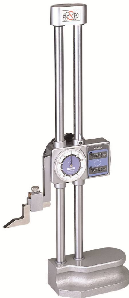
Рисунок 3 – Общий вид штангенрейсмасов серии 192 исполнение I