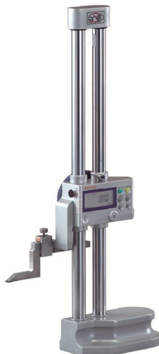
Рисунок 7 – Общий вид штангенрейсмасов серии 192 исполнение II и разъемом под контактный датчик