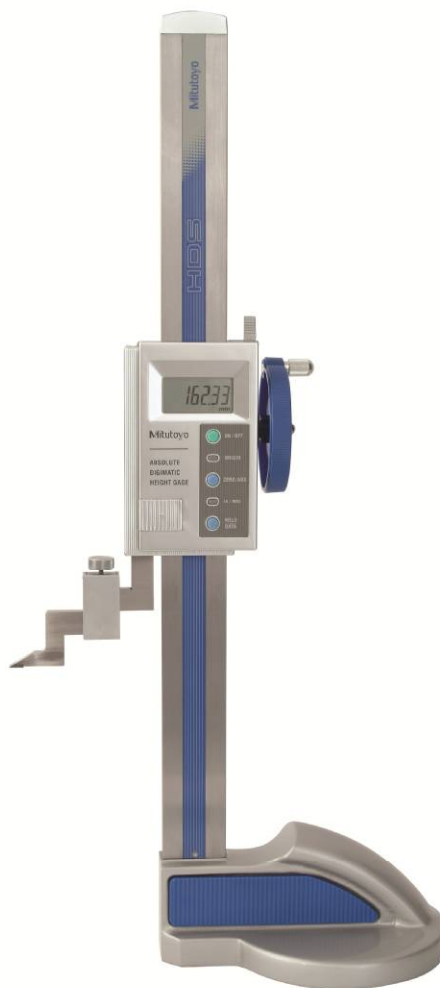
Рисунок 5 – Общий вид штангенрейсмасов серии 570 с большим маховиком