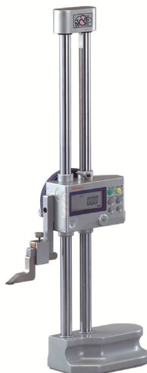
Рисунок 6 – Общий вид штангенрейсмасов серии 192 исполнение II