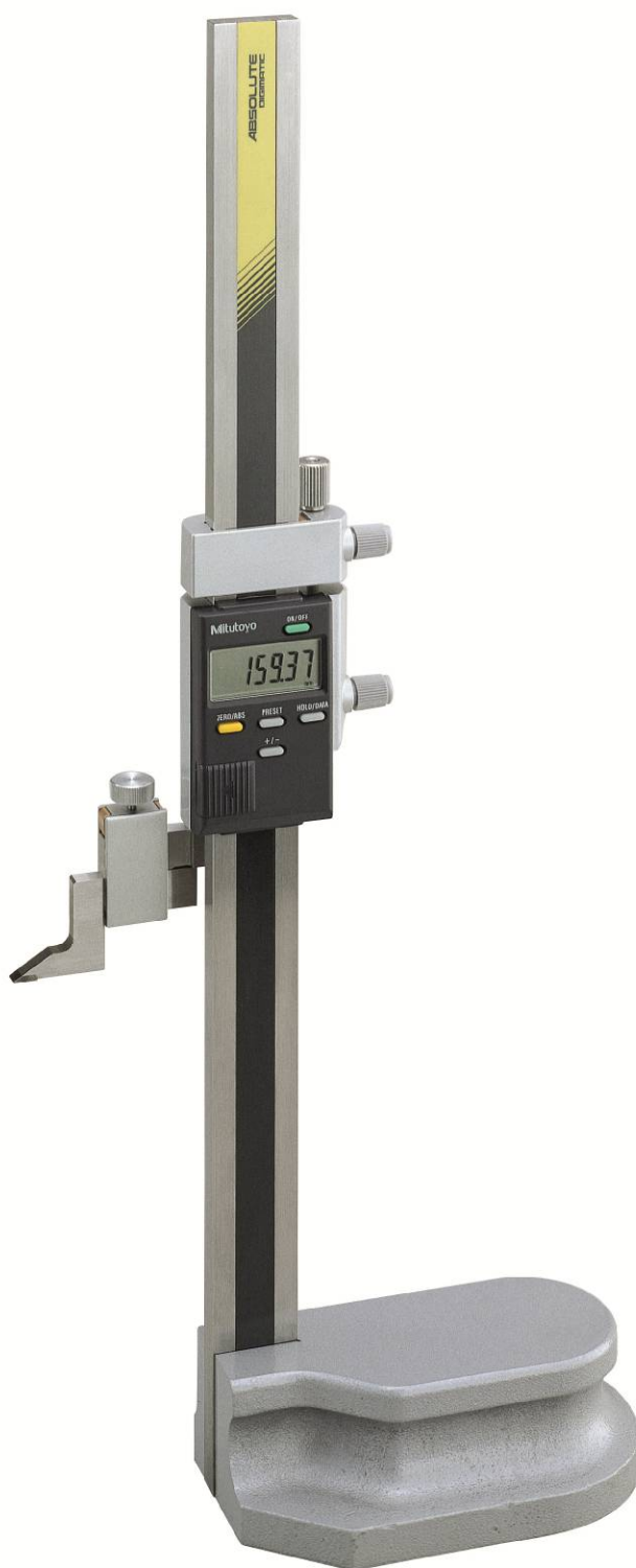
Рисунок 4 – Общий вид штангенрейсмасов серии 570