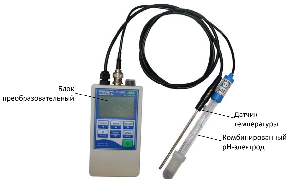
Рисунок 1 - Общий вид рН-метра MARK-903