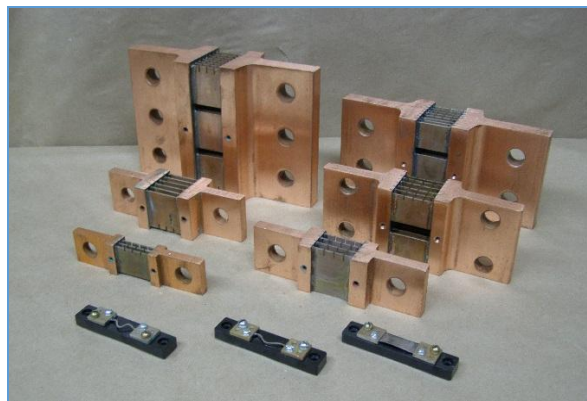
Рисунок 1 - Общий вид шунтов

Обозначение места нанесения знака поверки представлено на рисунке 2.