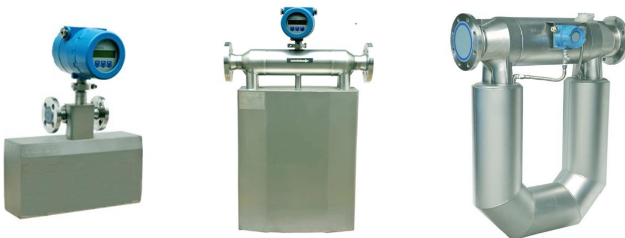
с Ду от 10 мм до 25 мм

Схема пломбировки от несанкционированного доступа представлена на рисунке 2. Пломбировка осуществляется изготовителем, или поверителем нанесением пломбировочных наклеек на вторичный преобразователь.