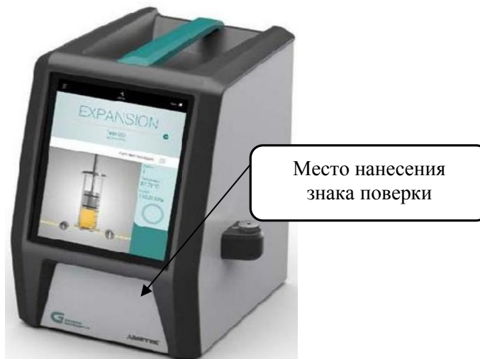
Рисунок 1 - Общий вид анализаторов

Для исключения возможности от несанкционированного доступа анализатор защищен двумя пломбами, расположенными на дне анализатора и представленными на рисунке 2.