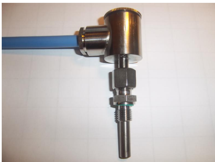
Рисунок 12 – Общий вид термопреобразователей сопротивления платиновых серии Ex модели Ex2xx модификации Ex223