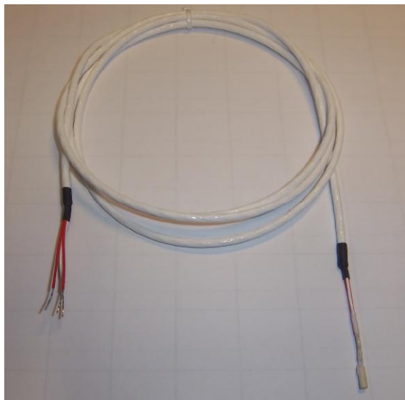
Рисунок 11 – Общий вид термопреобразователей сопротивления платиновых серии 10К