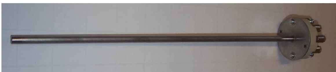
Рисунок 7 – Общий вид термопреобразователей сопротивления платиновых серии 2 модели 20 (20М)