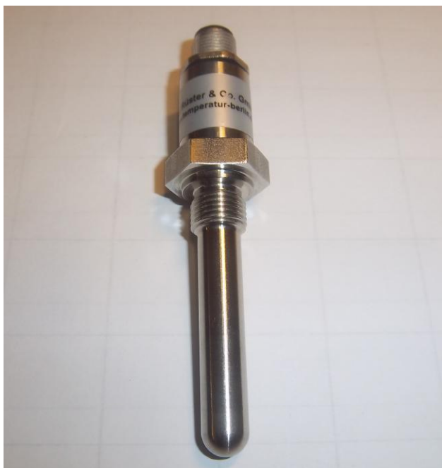
Рисунок 14 – Общий вид термопреобразователей сопротивления платиновых серии Ex модели Ex211Vi