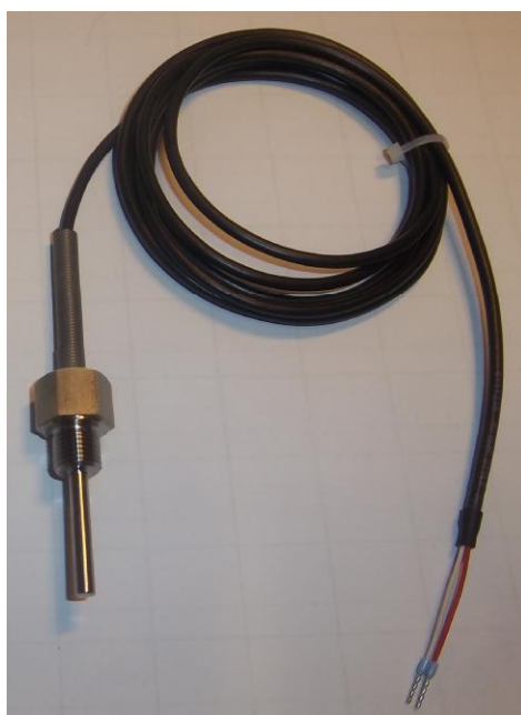
Рисунок 6 – Общий вид термопреобразователей сопротивления платиновых серии 2 модели 26х модификации 26G