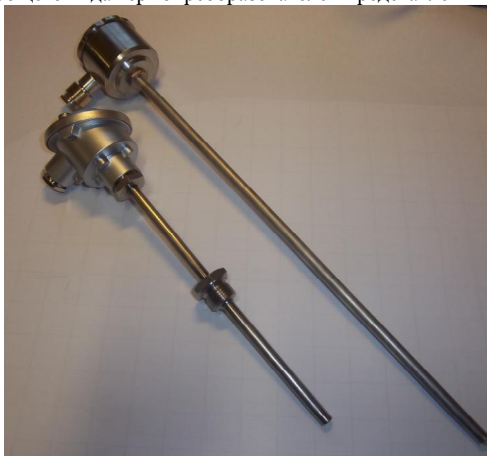
Рисунок 1 – Общий вид термопреобразователей сопротивления платиновых серии 2 модели 2xx модификаций 221и 212BR55

Фотографии общего вида термопреобразователей представлены на рисунках 1 - 14.