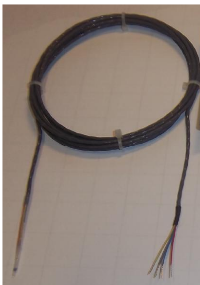
Рисунок 9 – Общий вид термопреобразователей сопротивления платиновых серии 2 модели 21FER