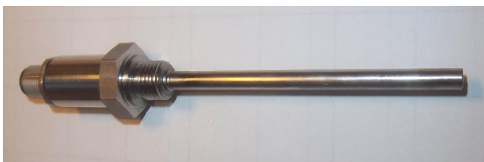
Рисунок 3 – Общий вид термопреобразователей сопротивления платиновых серии 2 модели 211Vi