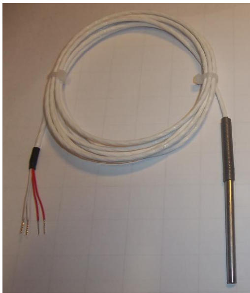
Рисунок 5 – Общий вид термопреобразователей сопротивления платиновых серии 2 модели 21х модификации 21А