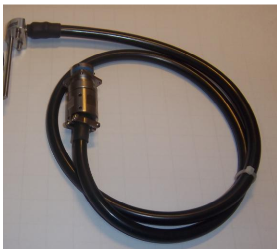
Рисунок 8 – Общий вид термопреобразователей сопротивления платиновых серии 2 модели 21wx модификации 21w5