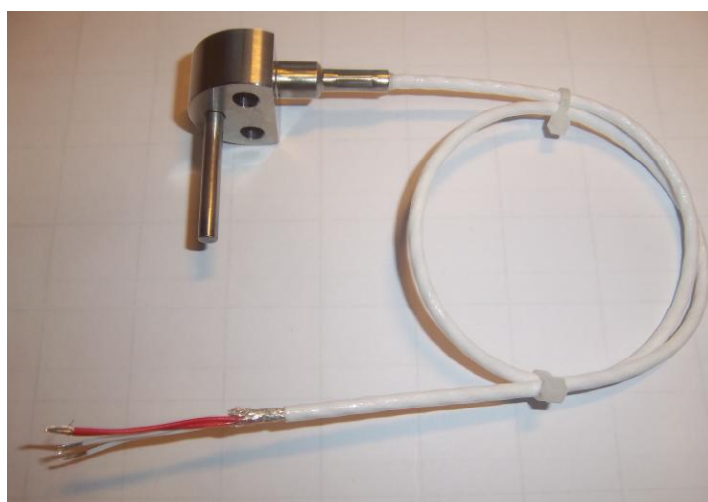
Рисунок 13 – Общий вид термопреобразователей сопротивления платиновых серии Ex модели Ex21w