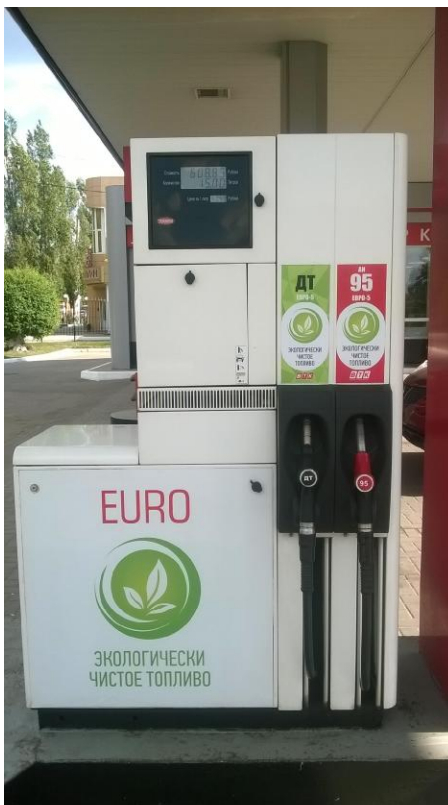
Рисунок 1 – Общий вид колонки

Общий вид колонки приведен на рисунке 1, места пломбирования на рисунках 2 – 3.