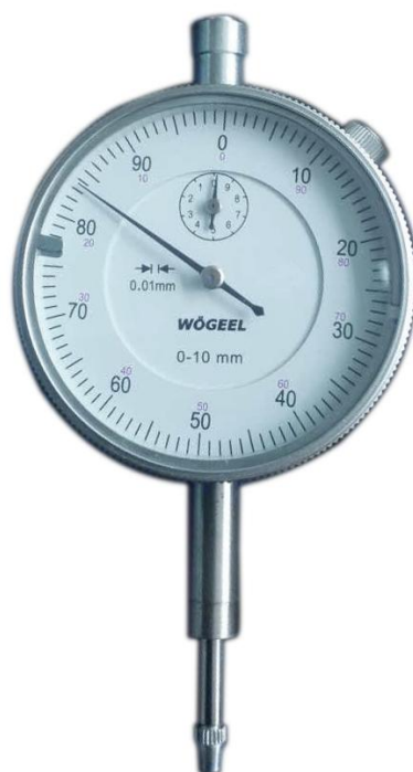
Рисунок 3 - Общий вид индикаторов часового типа с диапазоном измерений от 0 до 10 мм