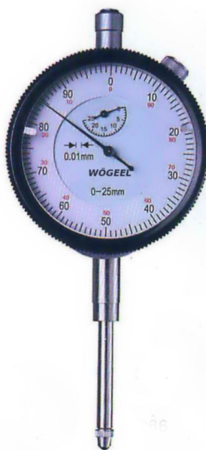
Рисунок 4 - Общий вид индикаторов часового типа с диапазоном измерений от 0 до 25 мм