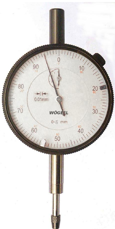
Рисунок 2 - Общий вид индикаторов часового типа с диапазоном измерений от 0 до 5 мм