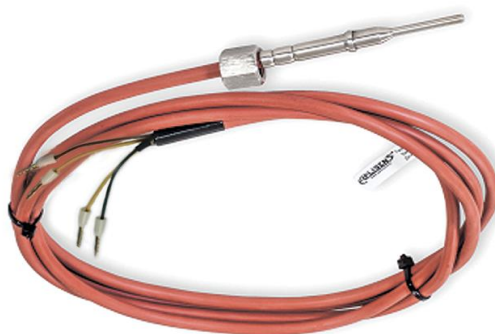
Рисунок 10 - Внешний вид типа с силиконовым (Silicon) кабелем. Степень защиты: IP68 (погружение не более 20м)

Типы преобразователей термоэлектрических СТУ кабельного типа (К):