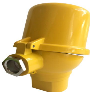
Рисунок 4 - Внешний вид тип DAW. Степень защиты IP65. Материал корпуса: алюминиевый сплав.