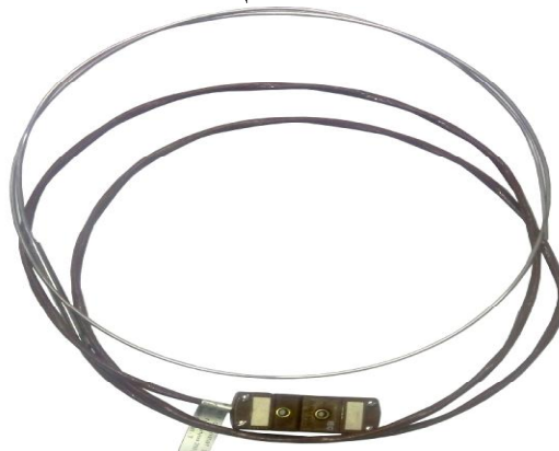
Рисунок 13 - Внешний вид типа в металлической оболочке (X). Степень защиты IP54