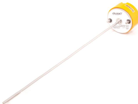
Рисунок 17 - Внешний вид с платформой и измерительным преобразователем