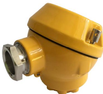
Рисунок 6 - Внешний вид тип MA. Степень защиты IP54. Материал корпуса: алюминиевый сплав.