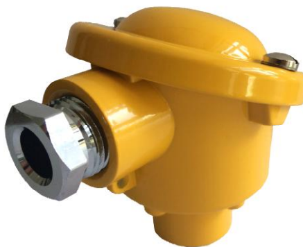
Рисунок 2 - Внешний вид тип B. Степень защиты IP54. Материал корпуса: алюминиевый сплав.