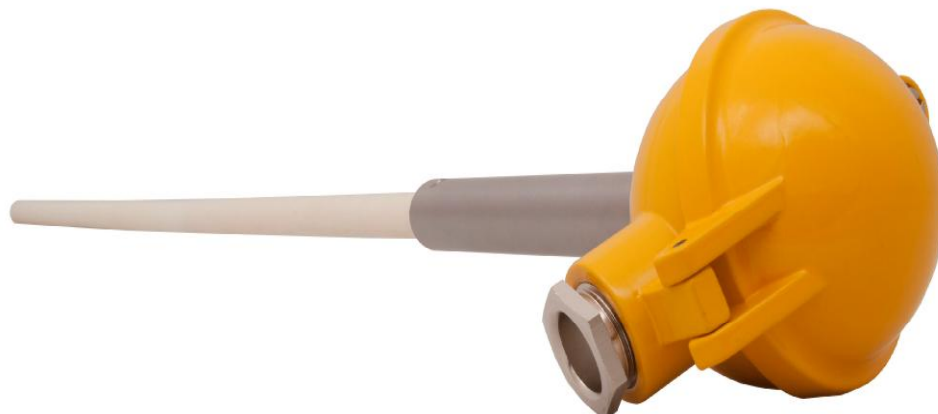
Рисунок 20 - Внешний вид ТП СТУ с защитным корпусом из корунда