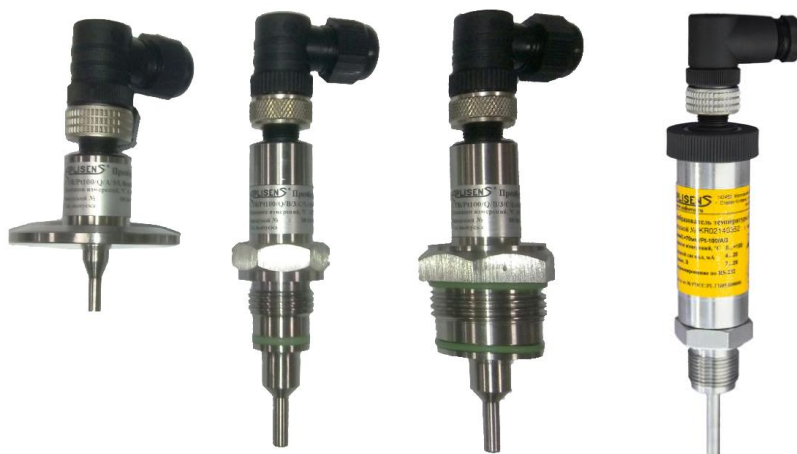
Рисунок 8 - Внешний вид тип PM. Степень защиты IP67

Типы разъёмных соединений, применяемых для ТП СТУ: