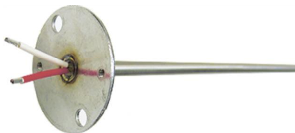
Рисунок 15 - Внешний вид с платформой для использования с клеммной колодкой или измерительным преобразователем