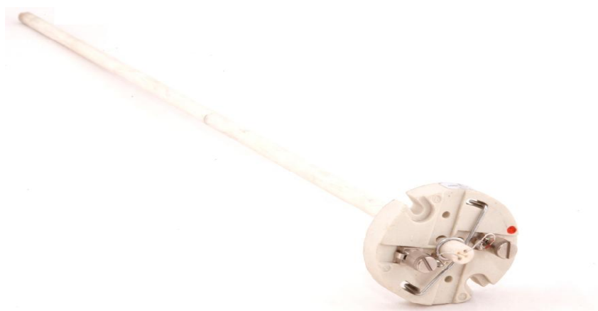
Рисунок 18 - Внешний вид с керамической оболочкой и керамической клеммной колодкой