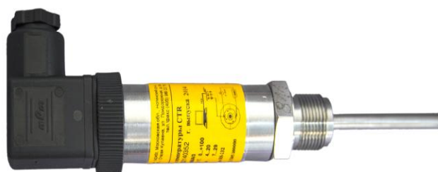
Рисунок 9 - Внешний вид тип PD. Степень защиты IP65