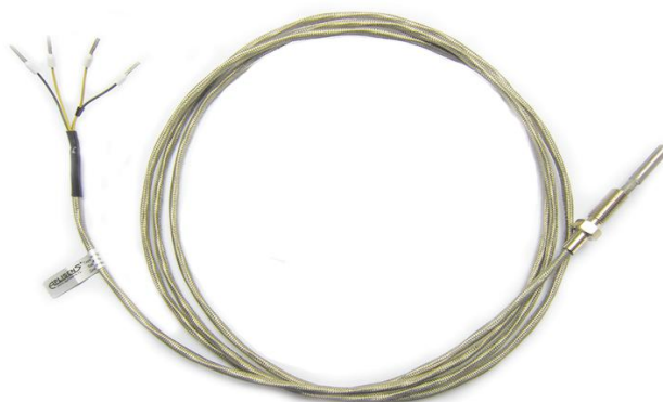
Рисунок 12 - Внешний вид типа с фторопластовым (ETFE) экранированным кабелем. Степень защиты IP66