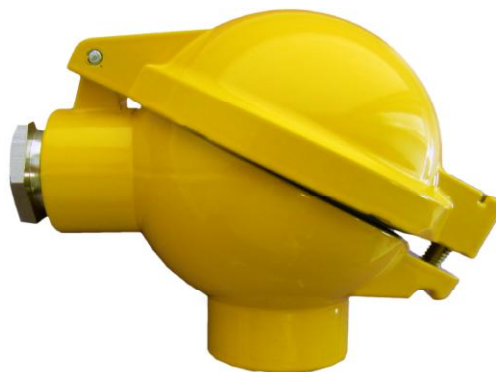
Рисунок 1 - Внешний вид тип NA. Степень защиты: IP65. Материал корпуса: алюминиевый сплав.