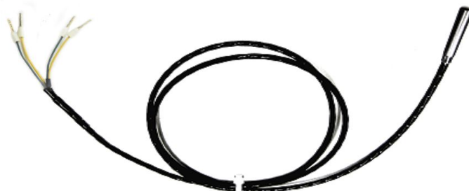
Рисунок 11 - Внешний вид типа с полиуретановым (PU) кабелем. Степень защиты IP67