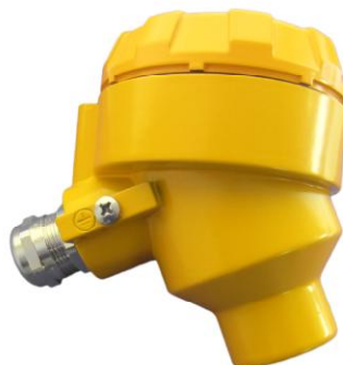
Рисунок 5 - Внешний вид тип DAO. Степень защиты IP66. Материал корпуса: алюминиевый сплав.