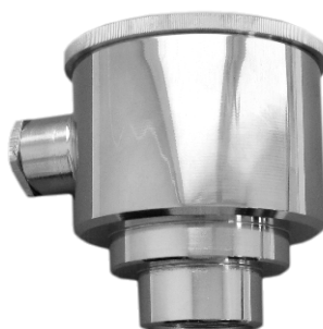
Рисунок 7 - Внешний вид тип PZ. Степень защиты IP65. Материал корпуса головки: нержавеющая никелированная сталь 304

Типы разъёмных соединений, применяемых для ТП СТУ: