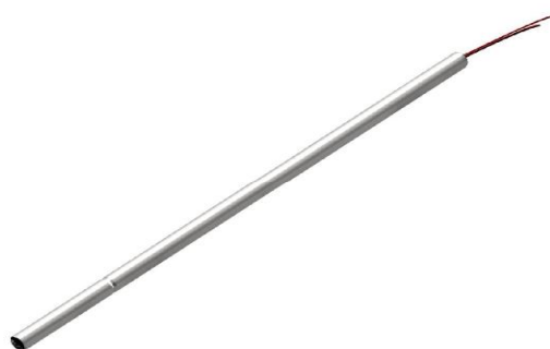
Рисунок 14 - Внешний вид без защитной головки и платформы для использования с клеммной колодкой или измерительным преобразователем