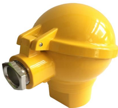
Рисунок 3 - Внешний вид тип DA. Степень защиты IP65. Материал корпуса: алюминиевый сплав.