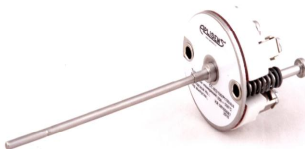
Рисунок 16 - Внешний вид с платформой и керамической клеммной колодкой (KZ)