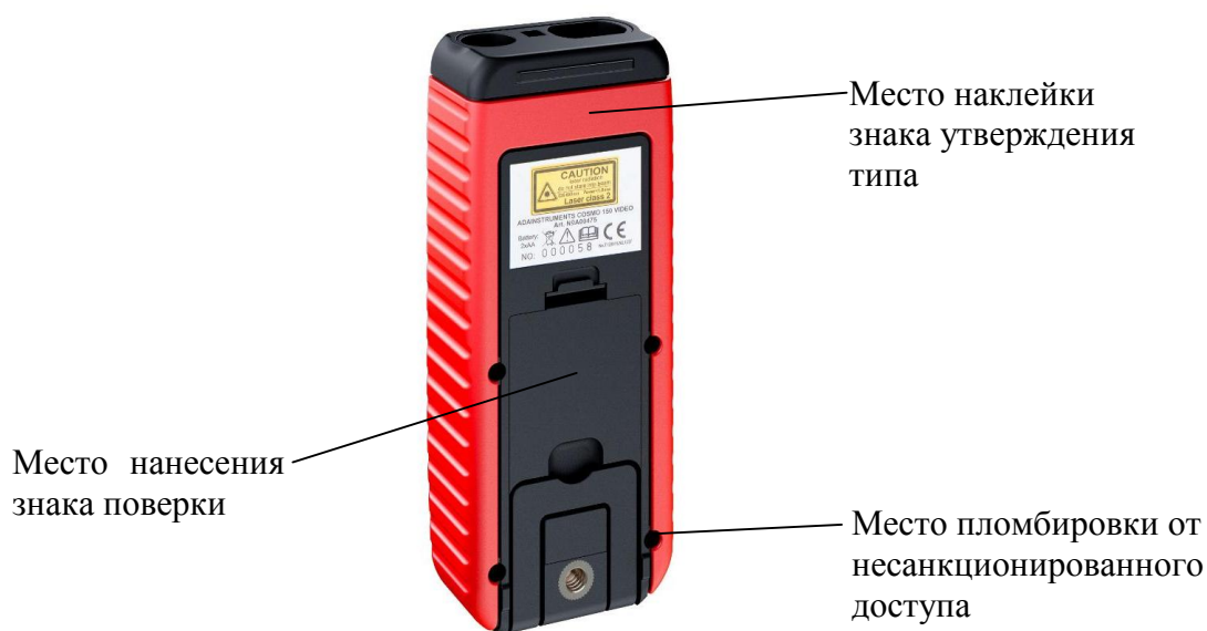
Рисунок 2 - Общий вид задней панели дальномеров лазерных ADA Cosmo