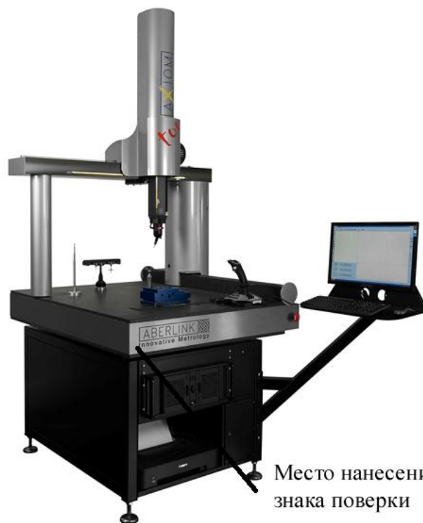
Место нанесения знака поверки