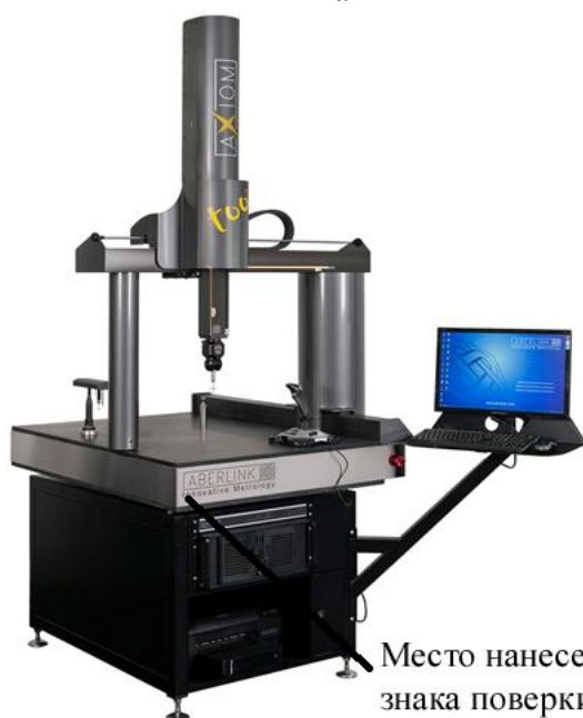
Место нанесения знака поверки