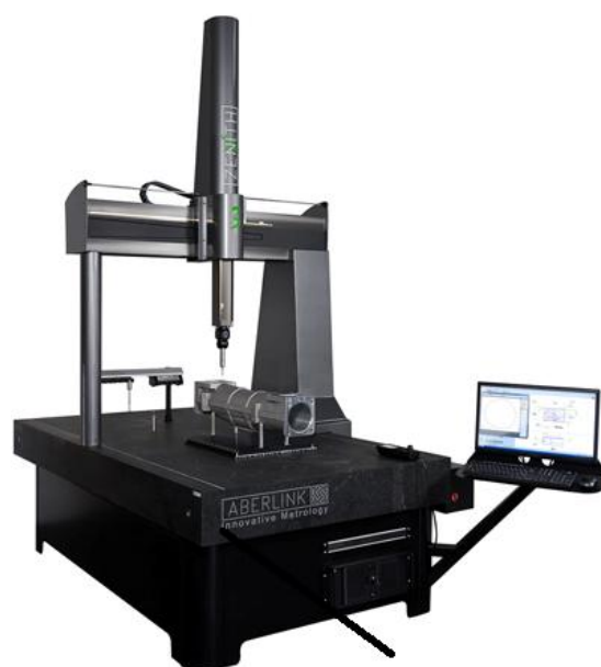
Место нанесения знака поверки