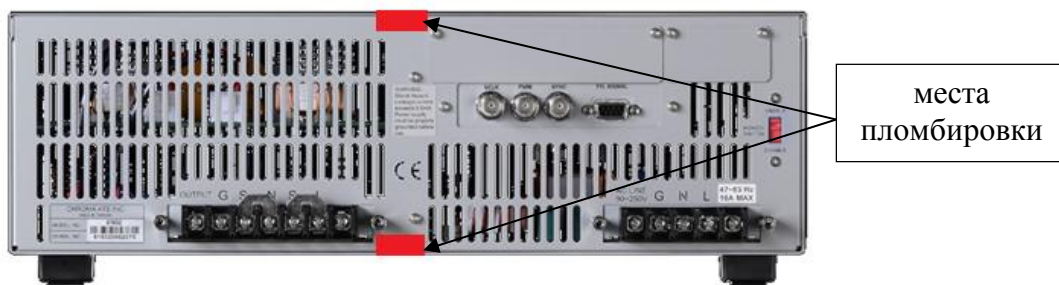
Рисунок 5 - Схема пломбировки от несанкционированного доступа