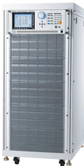
Рисунок 4 - Общий вид модификаций ТЕКО-61611, ТЕКО-61612