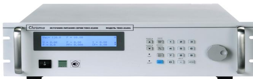
Рисунок 1 - Общий вид модификаций ТЕКО-61601, ТЕКО-61602, ТЕКО-61603, ТЕКО-61604

Общий вид средства измерений представлен на рисунках 1 - 5.