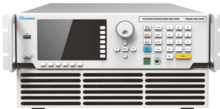
Рисунок 3 - Общий вид модификации ТЕКО-61609