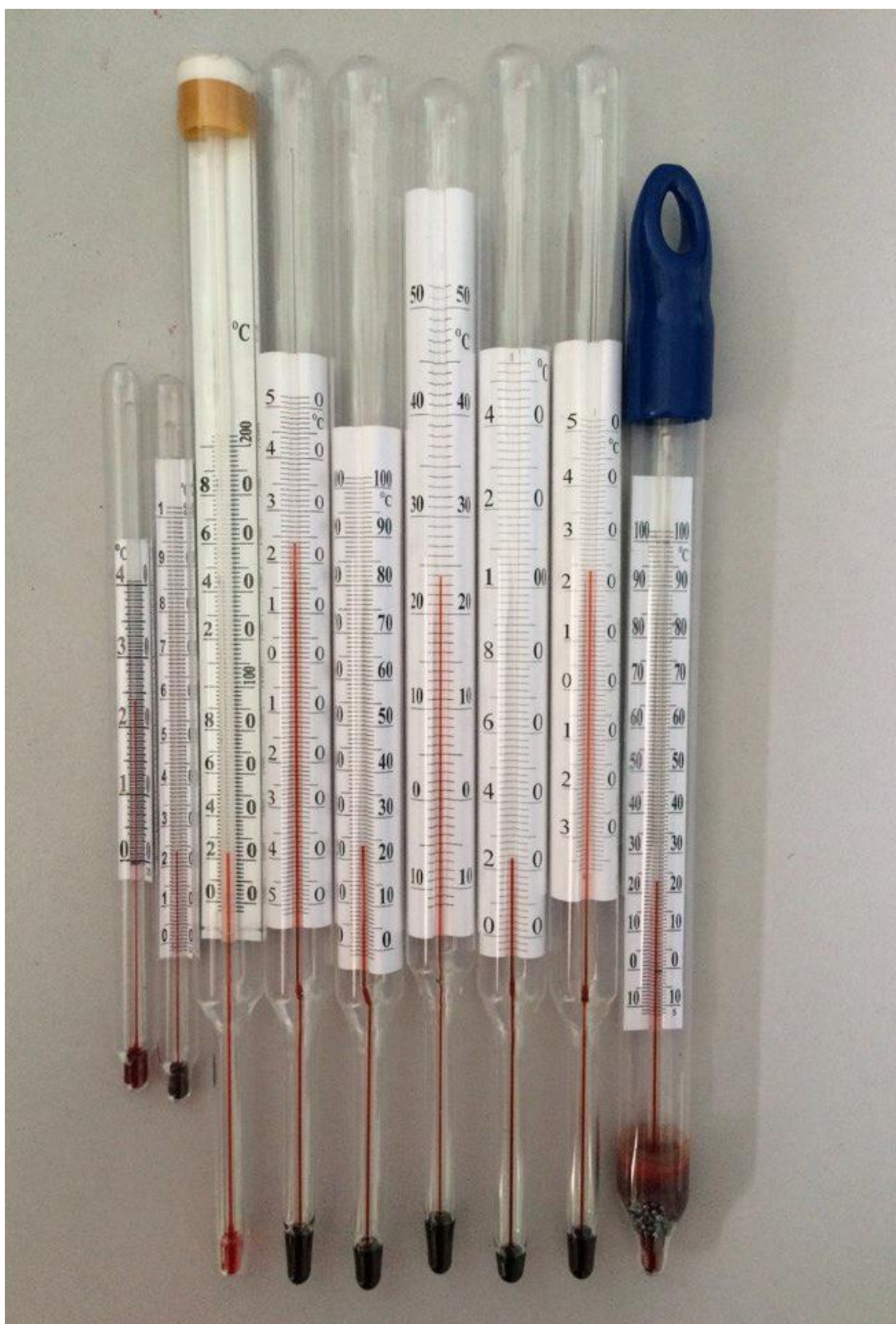
Рисунок 2 - Внешний вид термометров ТТЖ-Т, ТТЖ-СХ, ТТЖ-И, ТТЖ-В