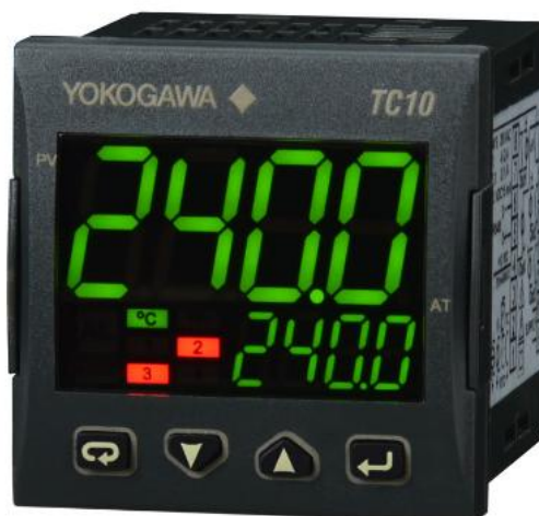
Рисунок 1 - Общий вид контроллеров

Фотография общего вида контроллеров и место нанесения знака поверки приведены на рисунках 1 и 2.