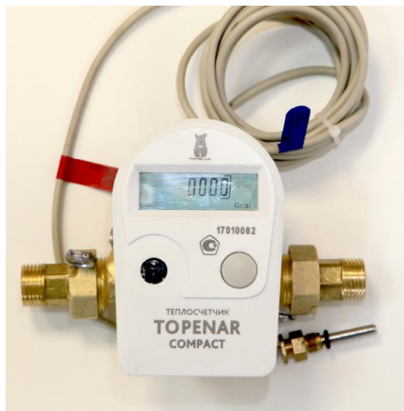
а) Модификация Топенар Компакт.