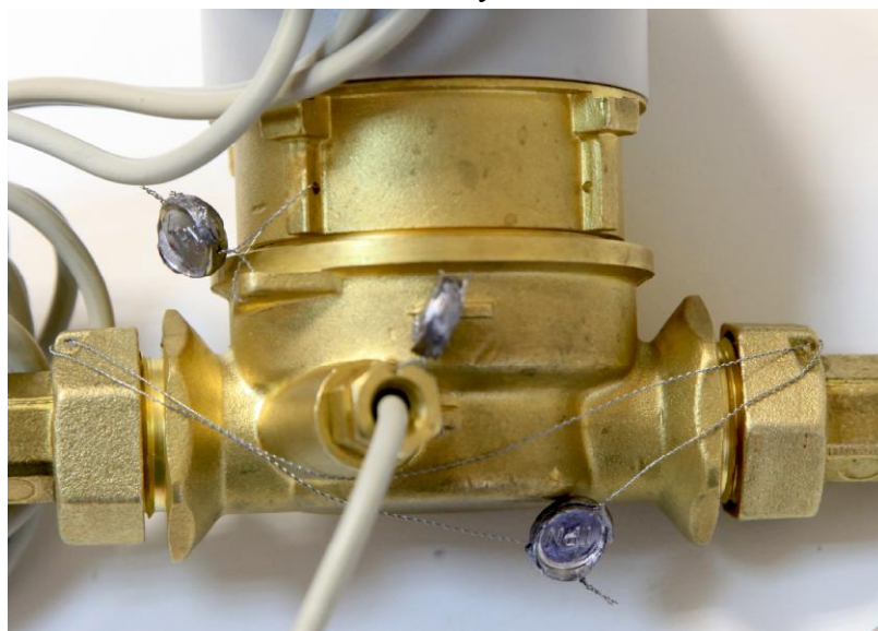
а) Места пломбирования энергоснабжающей организацией