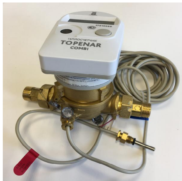
б) Модификация Топенар Комби.