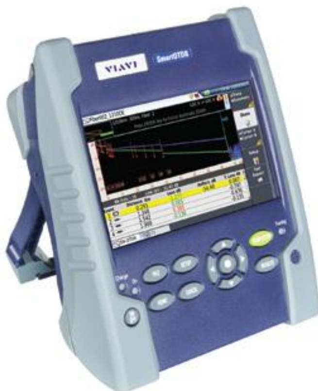
Рисунок 1 - Общий вид рефлектометров оптических серии SmartOTDR