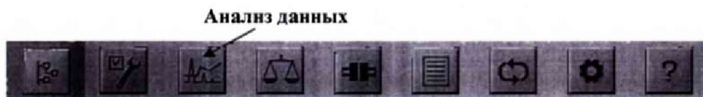
Рисунок 1 - Основное меню Safe Plant

Подключить УМС-16 (UMS-16) к ПК. Запустить ПО Safe Plant. В основном меню выбрать вкладку «Анализ данных» (Рисунок 1).