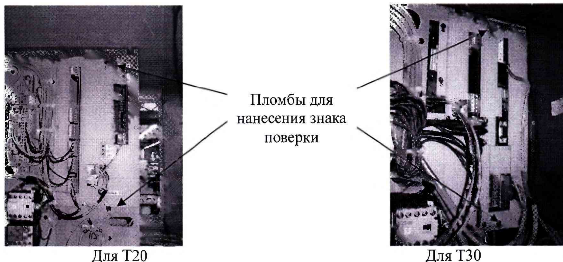
Рисунок 2 - Схема пломбирования крышки электронно-вычислительных устройств Т20 и Т30