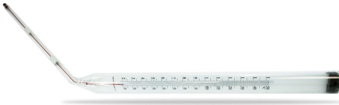
Рисунок 2 - Общий вид термометров максимальных стеклянных ТТЖ-М исп. 2